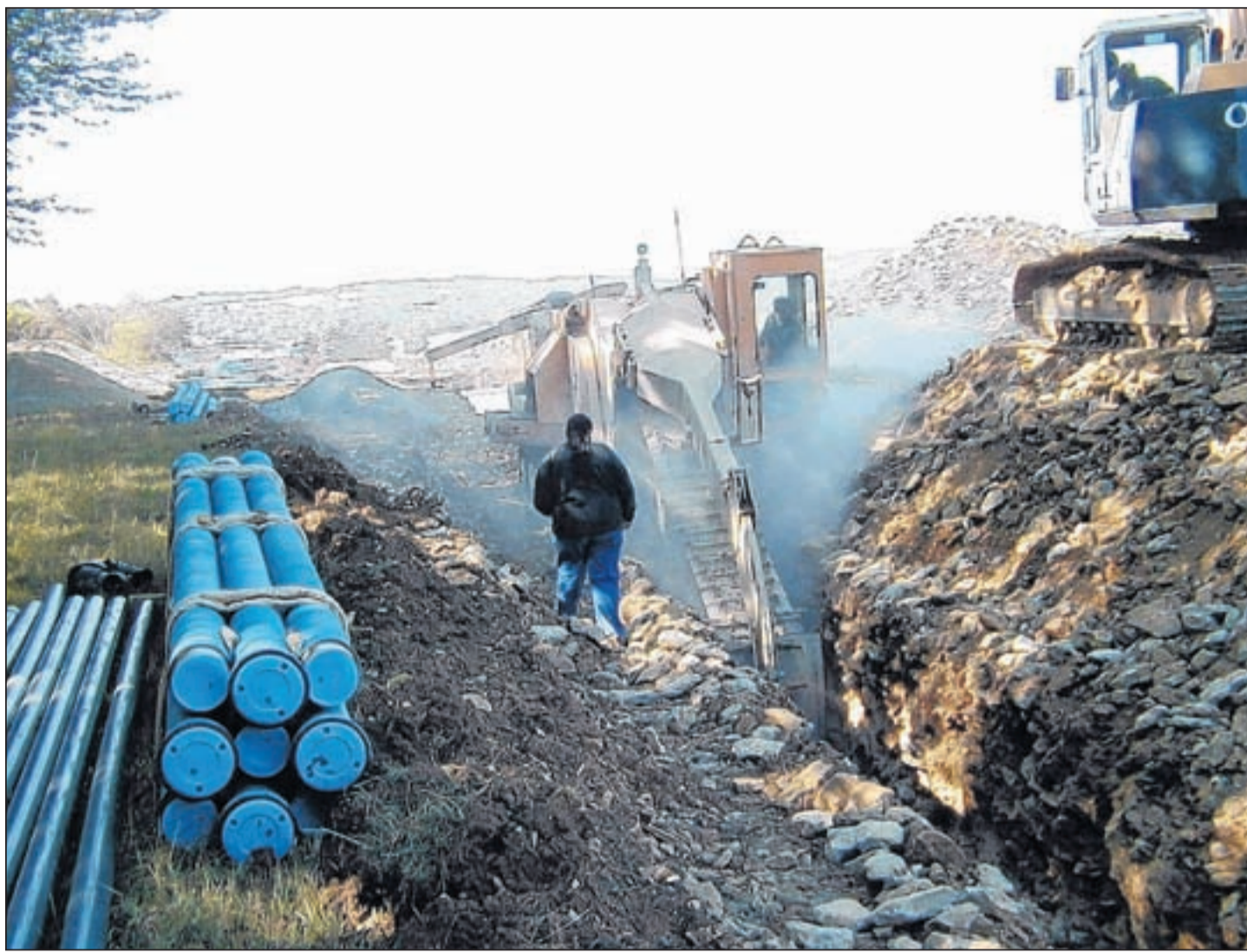
Großbaustelle: Das Ingenieurbüro „Walter + Partner“ hat viele Tätigkeitsbereiche. Zu den Schwerpunkten gehören Verkehrsplanung, Abwasserbeseitigung und Wasserversorgung.

Kraft: Nehmen wir den Fachbereich Straßenbau. Straßen sind noch immer der wichtigste Infrastrukturbaukasten; Mobilität ein Schlagwort unserer Zeit. Wenn wir den Auftrag für ein Straßenbauprojekt er-